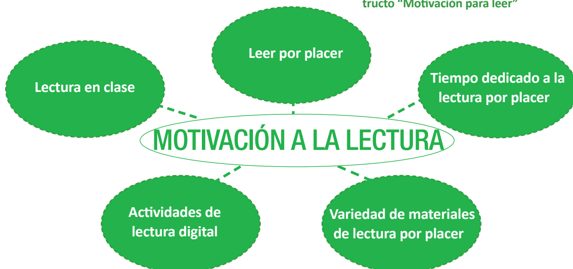
Figura: Índices que componen el constructo "Motivación para leer"