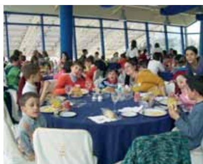
Jornada inolvidable. Escolares con NEE en el Parque de las Ciencias de Granada.