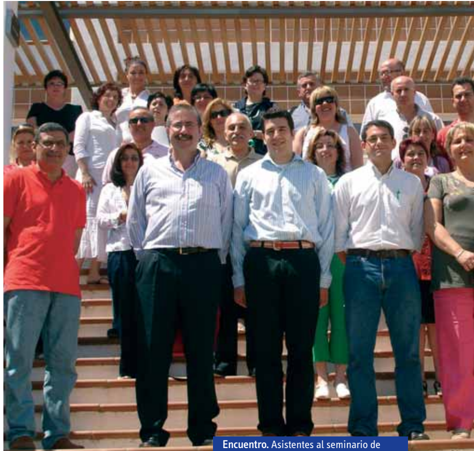
Encuentro. Asistentes al seminario de nutrición junto al director del CIO Mijas.

Los expertos han dado la voz de alerta y entidades como CODAPA ya se han puesto manos a la obra para adoptar medidas que ayuden a frenar el incremento de peso entre los escolares. En esta línea de acción cabe entender el convenio de colaboración firmado entre la Confederación y la Asociación de Diplomados Universitarios en Nutrición Humana y Dietética de Andalucía (ADUNDA) para promover y desarrollar conjuntamente programas de colaboración, entre