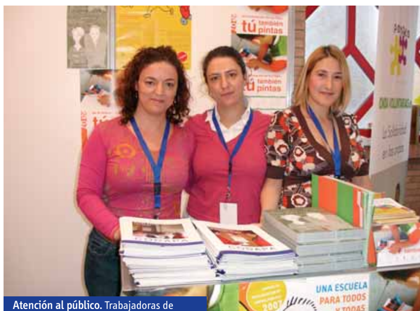
Atención al público. Trabajadoras de CODAPA, en el expositor asignado.