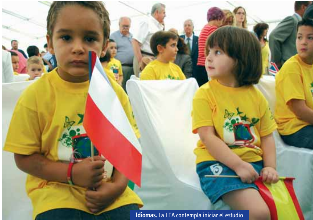
Idiomas. La LEA contempla iniciar el estudio de lengua extranjera desde Infantil.

La memoria económica de la LEA (con una inversión de 1.175 millones de euros) contempla la incorporación de 15.019 docentes entre 2008 y 2012. Con esta ampliación de las plantillas se pretende iniciar el estudio de lengua extranjera en el último curso de Educación Infantil (una hora y media) y en el primer ciclo de Primaria (tres horas semanales), así como la reducción del número de alumnos por aula en centros con problemas de tipo sociocultu-