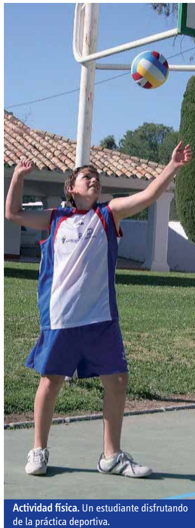
Actividad física. Un estudiante disfrutando de la práctica deportiva.

Durante el curso que acaba de concluir, han participado en dicho