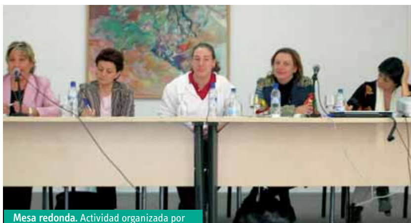
Mesa redonda. Actividad organizada por FDAPA Málaga.

A continuación se desarrolló una mesa redonda en la que participaron ambas ponentes, junto a una alumna del IES Portada Alta y de la