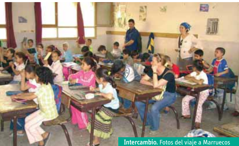
Intercambio. Fotos del viaje a Marruecos y la mesa redonda correspondiente.