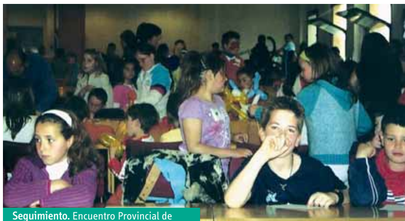
Seguimiento. Encuentro Provincial de APAs en la Universidad de Jaén.

Un curso más, hemos detectado la gran necesidad existente por parte de las APAs en los aspectos formativo e informativo, motivo por el que pretendemos reforzar el plan de formación en los años sucesivos, incrementando la partida económica y también aumentando la dotación de recursos humanos.