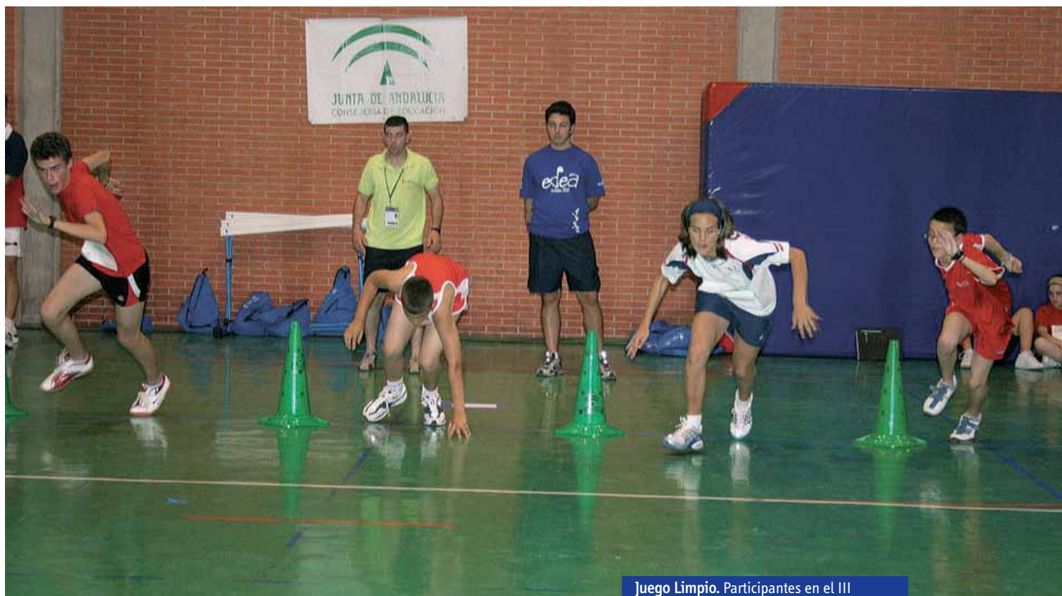
Juego Limpio. Participantes en el III Encuentro Deportivo Escolar de Andalucía.

persigue fines como el de mejorar la integración de colectivos desfavorecidos y potenciar la convivencia entre los sectores de la comunidad escolar a través de la participación en las actividades deportivas del centro, por citar algunos casos.