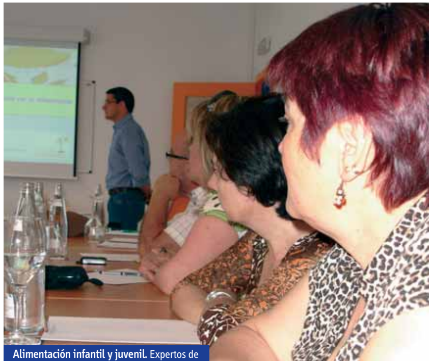
Alimentación infantil y juvenil. Expertos de ADUNDA formando a miembros de APAs.