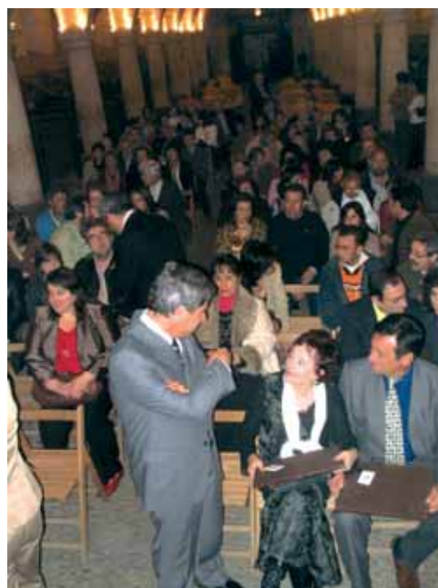
Actividades. Jornada sobre Necesidades Educativas Especiales celebradas en Córdoba.

La federación cordobesa cumple su primer cuarto de siglo de existencia, una buena ocasión para hacer memoria, agradecer la contribución de muchos padres y madres durante todo este tiempo y afianzar objetivos