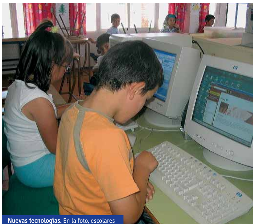
Nuevas tecnologías. En la foto, escolares del CPR Guadiato, de Córdoba.

En todo caso, el decreto correspondiente al Bachillerato se encuentra en estos momentos en estudio y aún deberá pasar por varios trámites antes de recibir vía libre. De ser así, y según las primeras estimaciones, la norma comenzaría a aplicarse en el curso 2009-2010.