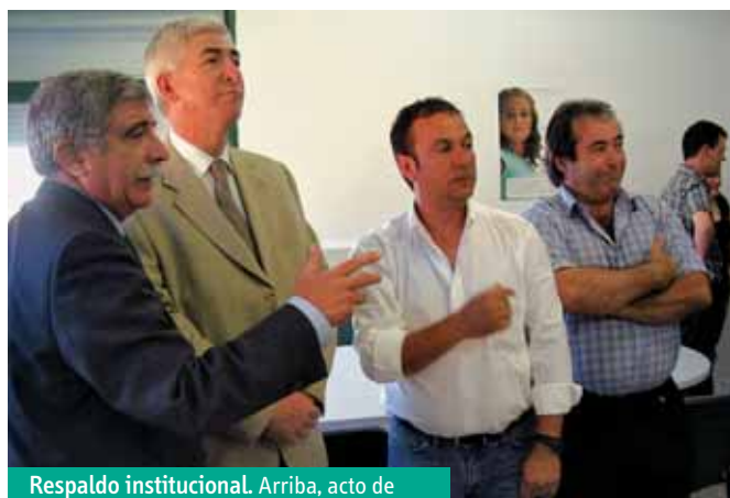
Respaldo institucional. Arriba, acto de inauguración de la sede de FEDAPA.

Desde su recién estrenada oficina en el colegio Adolfo de Castro, FEDAPA pondrá en marcha un proyecto para impulsar la participación de padres y madres